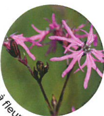
Silène à fleur de coucou