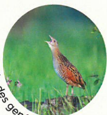
Râle des genêts