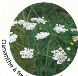
Oenanthe à feuilles de silaüs