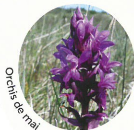
Orchis de mai